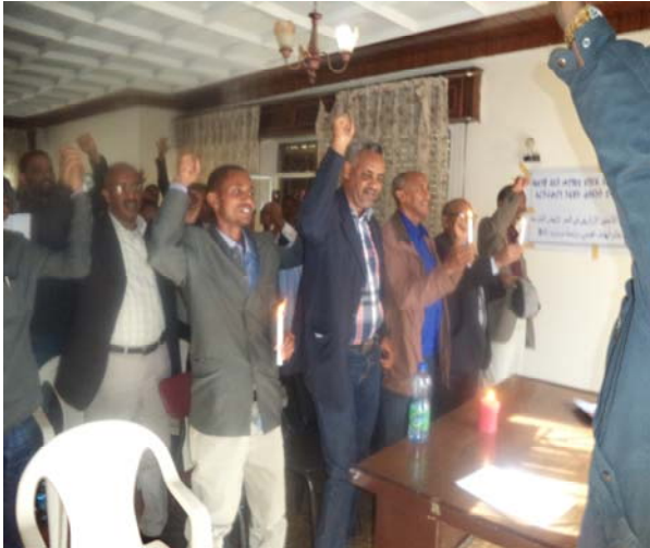
ቤት ጽሕፈት ዜናን ባህልን ኤርትራዊ ሃገራዊ ባይቶ ንደሞክራሲያዊ ለውጢ 04 ግንቦት 2015