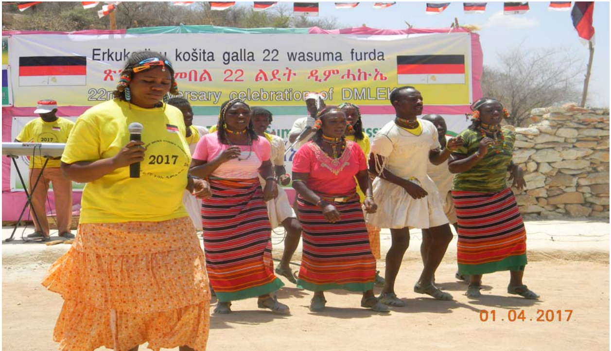
ብከምዚ ኣብ ላዕሊ ዝተገልጸ መሰረት ብኤርኩ ባንድ ተዓጂቡ ድርብን ታሪኻዊ በዓልን መዕጸዊ ሓሙሻይ ውድባዊ ጉባኤ ዲምሓኩኤ ክሳብ ሰዓት 5:00 ብክብ ዝበለ ድምቕት ተኸቢሩ።